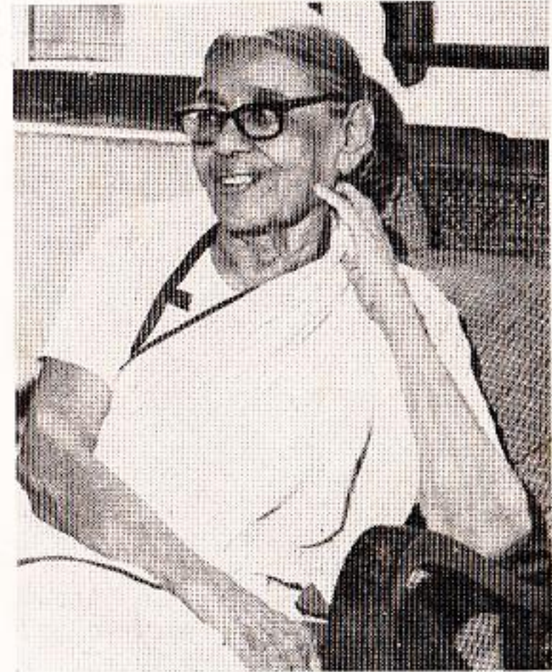
एक अनौपचारिक प्रसन्न हास्य : ताराबाई ऍंशीच्या घरात